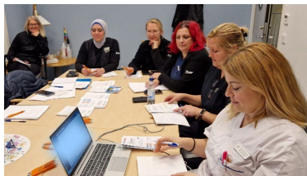
Samverkan i fokus vid GÖTE-mötet.