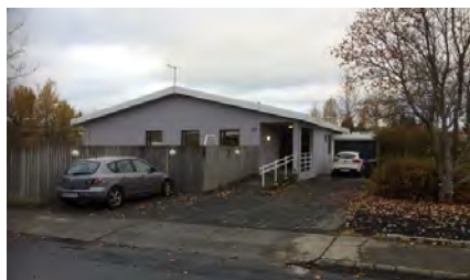
Mariuhús – Blesugróf 27 Reykjavík 22 patienter