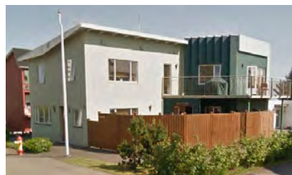
Fríðuhús – Austurbrún 31 Reykjavík 18 patienter