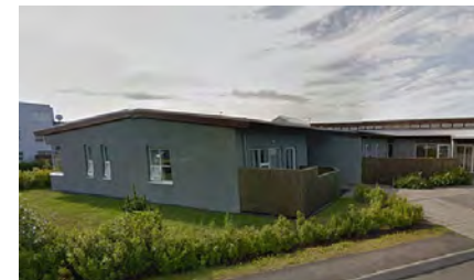
Roðasalir – Roðasalir 1 Kópavogur 20 patienter

122 specialicerade dagrehabspatser i Reykjavik med omnejd