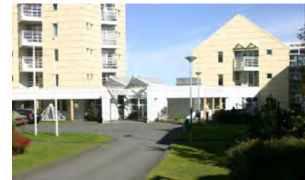
Vitatorg – Lindargata 59 Reykjavík 18 patienter