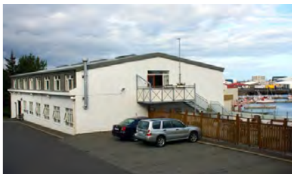
Drafnarhús – Hafnarfjörður 22 patienter