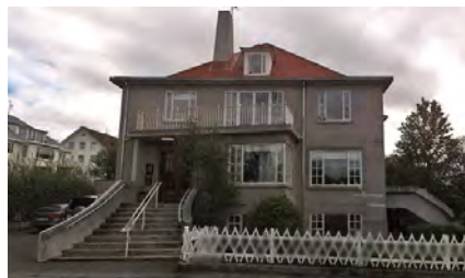
Hlíðabær – Flókagötu 53 Reykjavík 22 patienter